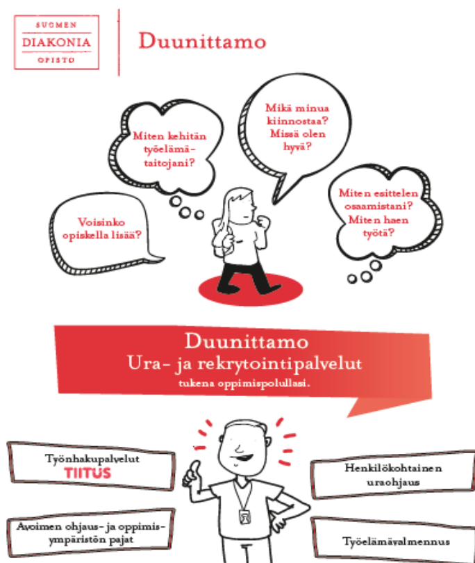
Kuva 4: Duunittamo

Vastauksena uraohjauksen tarpeen lisääntymiseen Suomen Diakoniaopistolla on kehitetty uusi palvelukokonaisuus, Duunittamo, jonka alle uraohjaukseen liittyvät palvelut sijoittuvat.