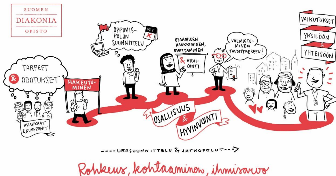
Kuva 1: Opiskelijan osaamisen kehittämisen polku

Ohjaussuunnitelmassa kuvataan ohjauksen tavoitteet ja periaatteet sekä ohjauksen järjestäminen Suomen Diakoniaopistossa. Ohjaussuunnitelma toimii oppilaitoksen ohjauksen tiedottamisen, toiminnan toteuttamisen ja kehittämisen käsikirjana. Suomen Diakoniaopiston pedagogisena strategiana on valmentava pedagogiikka, joka vaikuttaa myös ohjaustoiminnan taustalla. Valmentava pedagogiikka on toimintamalli, jonka tavoitteena on yhteistoiminnallinen, vuorovaikutuksellinen ja vastuullinen oppiminen tiimityöskentelyä hyödyntäen. Ohjaustoimintaa ohjaavat myös SDO:n arvot: rohkeus, kohtaaminen ja ihmisarvo.